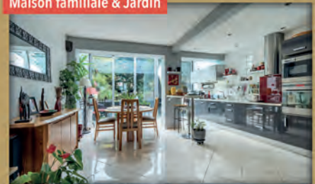
Maison familiale & Jardin

À vendre - Quartier Chefson - Bois-Colombes