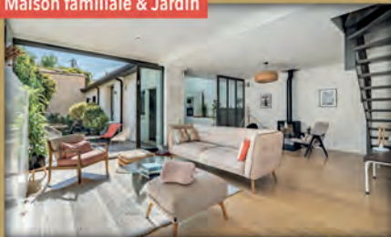
Maison familiale & Jardin

À vendre - Quartier Mermoz - Bois-Colombes