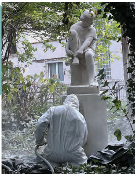
Le 15 octobre 2024, un restaurateur spécialisé en sculpture et moulage est intervenu sur la sculpture.

Depuis juin 1942, cette sculpture de Pierre Charles Lenoir (1879-1953), prêtée par la ville de Paris (collection du Fonds d'art contemporain), fait la singularité du square Émile-Tricon, aménagé vers 1938-1939. Recensée dans l'inventaire des monuments et des richesses artistiques de la France, cette sculpture, en pierre de Bourgogne de couleur rosée, posée sur un socle en pierre d'Euville, est une des pièces notables du patrimoine sculptural de la ville. Venez découvrir ou redécouvrir cette jeune femme au style vestimentaire des années folles.