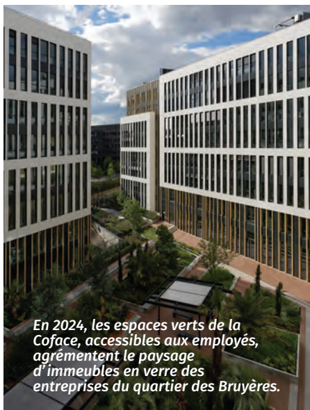
En 2024, les espaces verts de la Coface, accessibles aux employés, agrémentent le paysage d'immeubles en verre des entreprises du quartier des Bruyères.

ment de la gare de marchandises. En 2023, c'est enfin la société Sagemcom qui occupe une partie des derniers immeubles aménagés allée des Messageries (secteur des télécommunications, 1 000 salariés).