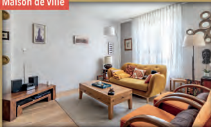
Maison de ville

À vendre - Quartier Mermoz - Bois-Colombes