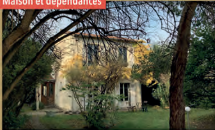
Maison et dépendances

À vendre - Quartier Champarons - Bois-Colombes