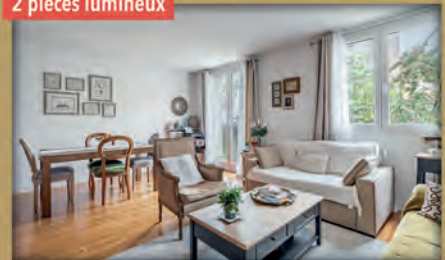
2 pièces lumineux

À vendre - Quartier Gare - Bois-Colombes