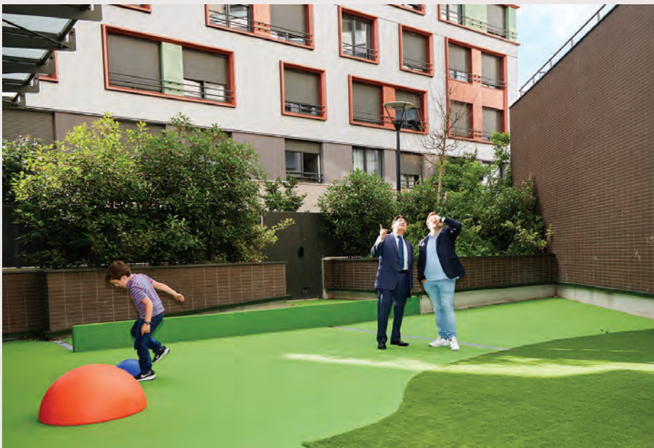
Les élus visitent la crèche À petits pas, présente dans la zone d'aménagement concerté Pompidou/Le Mignon, au plus près des habitants.

G.B. : Pour Bois-Colombes, le PLUi est l'occasion de concilier plusieurs défis : préserver notre identité, notamment nos quartiers pavillonnaires, tout en répondant aux exigences de densification