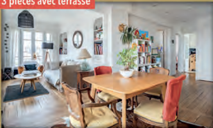
3 pièces avec terrasse

À vendre - Quartier Raspail - Bois-Colombes