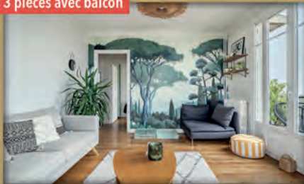
3 pièces avec balcon