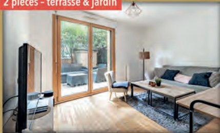
2 pièces - terrasse & jardin